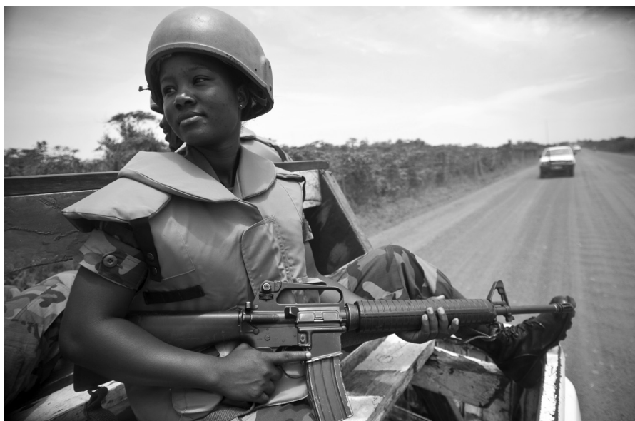
▲ Efectivo militar de mantenimiento de la paz ghanés en patrulla en Buchanan, Liberia. Abril de 2009.

durante esta tarea para asegurar una visión general más exhaustiva de la situación local. Por ejemplo, al realizar actividades al aire libre, tales como recolectar agua y leña, y en las actividades comerciales, las mujeres pueden observar de manera directa los movimientos y acciones que pueden afectar el ambiente de seguridad. Esta información puede elevar el entendimiento de los efectivos de la misión de paz sobre el ambiente de seguridad y mejorar sus intervenciones.