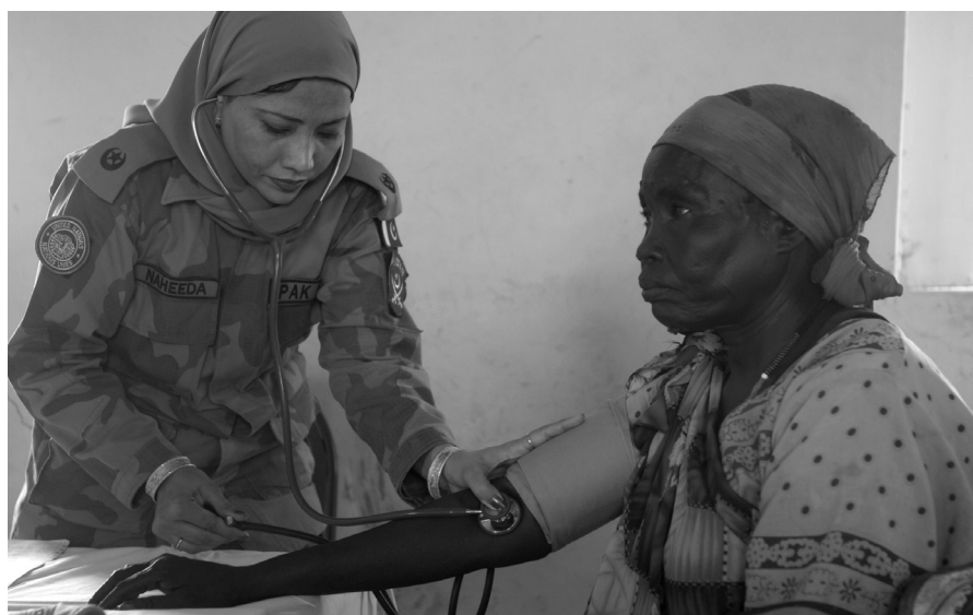
▲ Miembro de un equipo médico pakistaní trata a una paciente local en Ed-Damazin, Sudán. Noviembre de 2008.

La presencia de personal militar femenino también puede fomentar las estrategias de protección y respuesta, ya que las mujeres y niños locales pueden