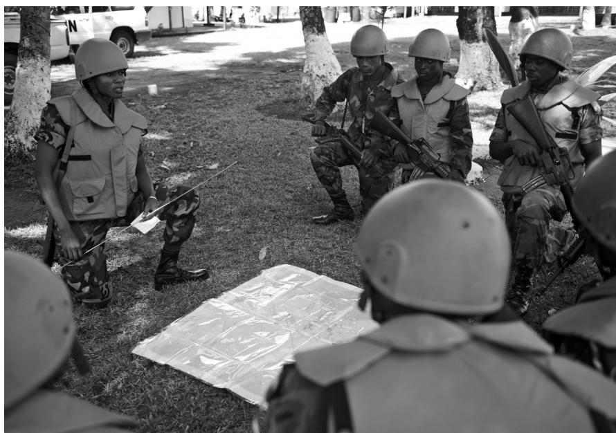
▲ Efectivos militares de mantenimiento de la paz ghaneses en Buchanan, Liberia. Abril de 2009.

evaluación técnica. Este enfoque asegurará que los asuntos de género influyan en los planes militares estratégicos y continúen informando sobre la planificación e implementación futura durante toda la misión de mantenimiento de la paz, a nivel operacional y táctico.