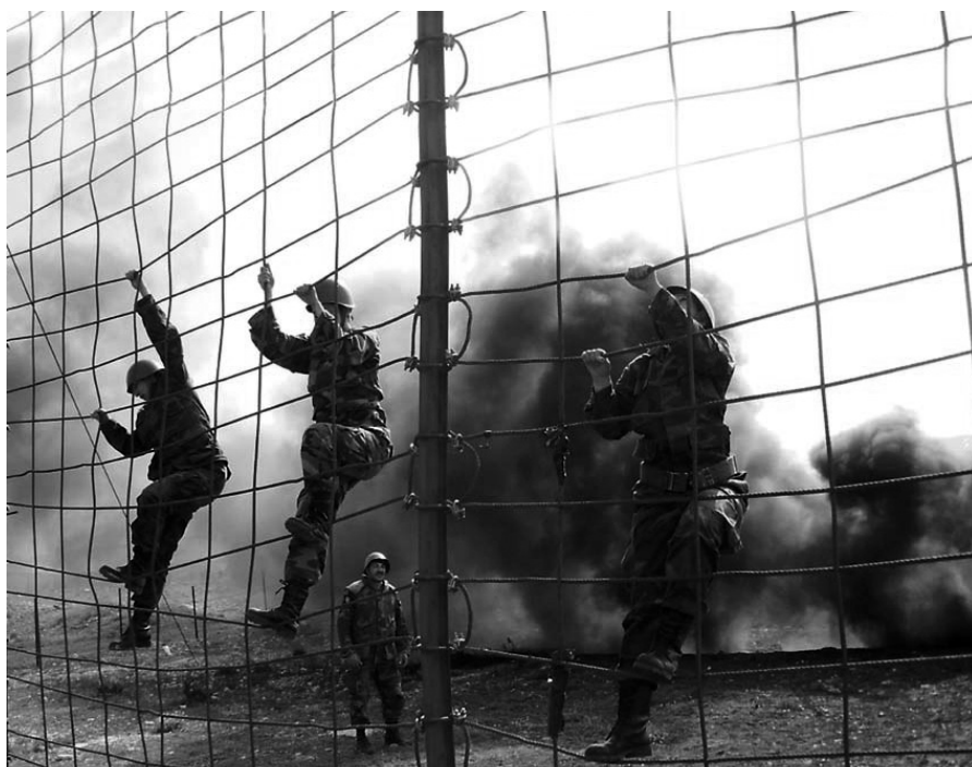
▲ Oficiales militares femeninas trepan una escalera de cuerda durante un entrenamiento, 2009.

El rol orientador desempeñado por los efectivos militares de la misión de paz hacia sus contrapartes de las fuerzas armadas del país anfitrión proporciona una oportunidad de liderar con el ejemplo, tanto en términos del perfil de los efectivos de la misión de paz, como sus estándares de comportamiento. El despliegue de efectivos militares femeninos de la misión de paz puede tener un impacto en cuanto a modelos a seguir, facilitando un mayor reclutamiento de mujeres locales a las fuerzas nacionales de seguridad. De igual valor es el rol de establecimiento de estándares de los efectivos militares de la misión de paz en términos de conducta y disciplina. Los efectivos militares de la misión de paz también debieran mantener los más altos estándares de profesionalismo militar y adherirse estrictamente a la política de tolerancia cero en relación con los actos de abuso y explotación sexual de las mujeres y niñas, a las cuales deben proteger en los lugares donde son desplegados.